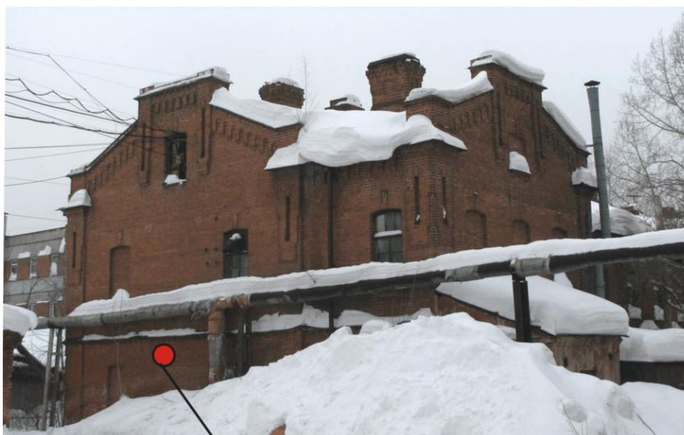
Место расположения информационной надписи