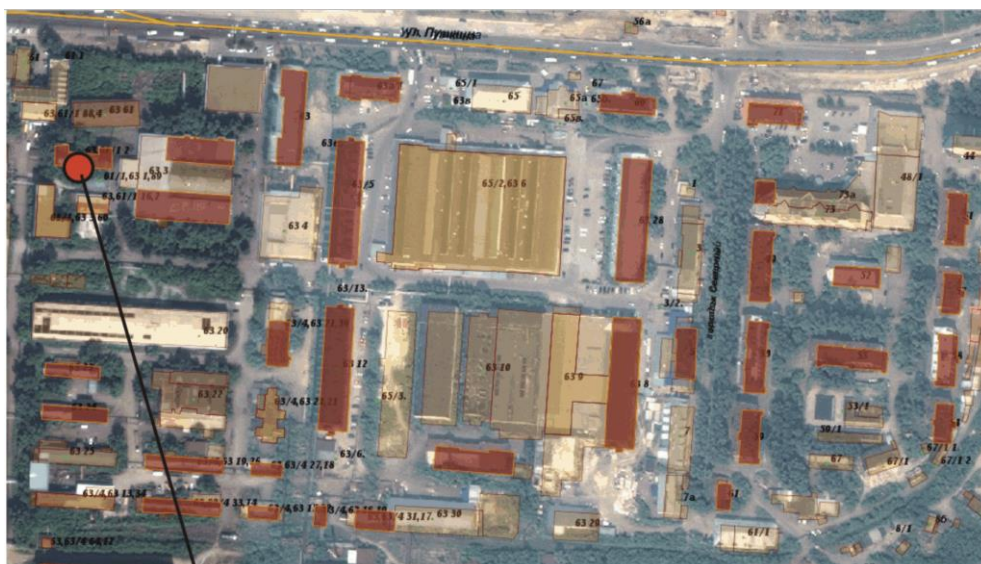
Место расположения информационной надписи