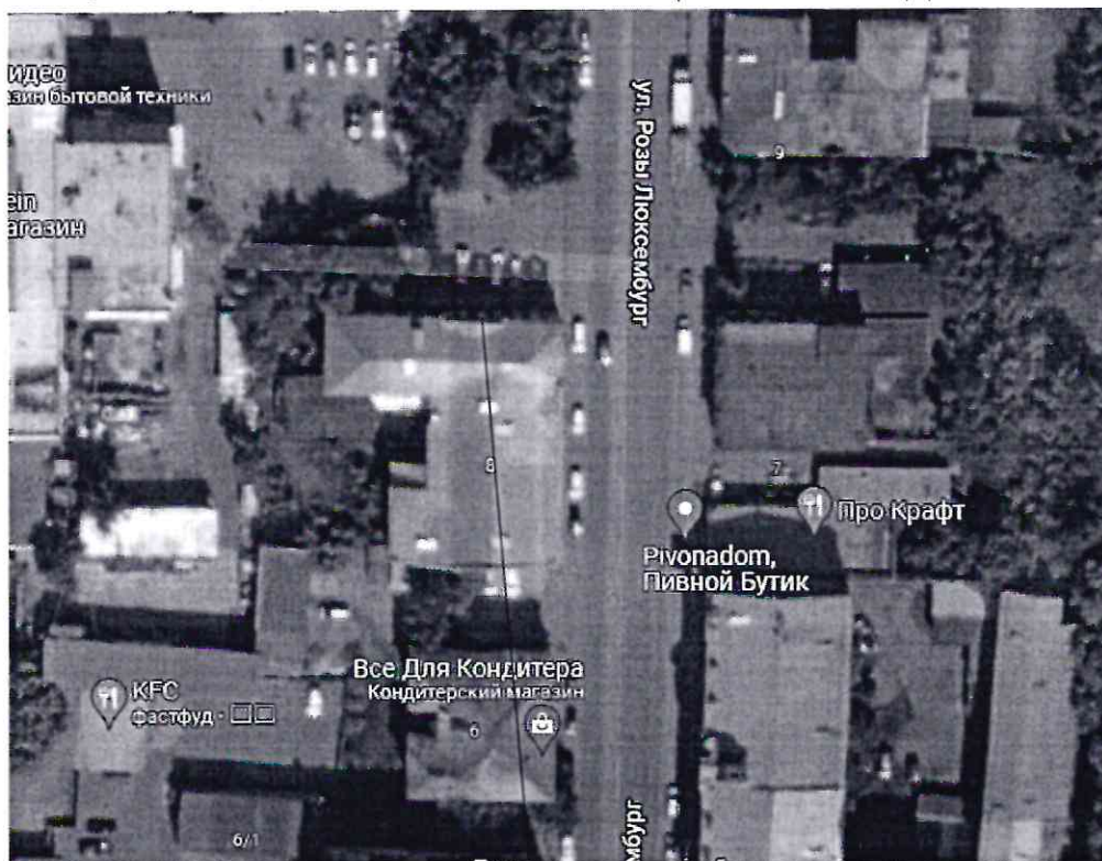
Место расположения информационной надписи