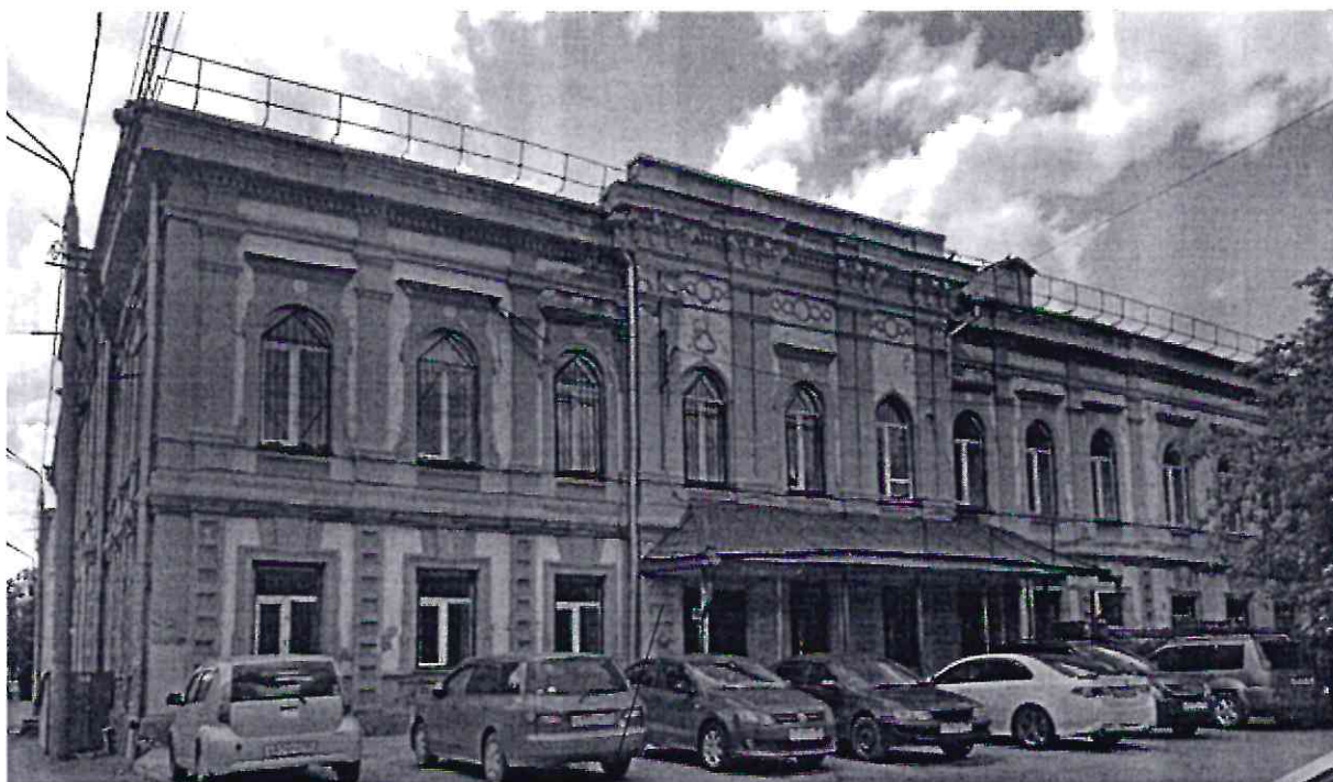
Место расположения информационной надписи