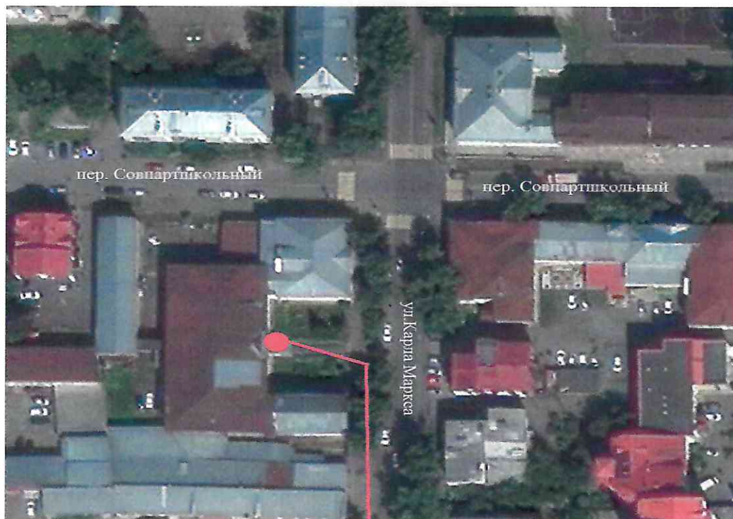
Место расположения информационной надписи