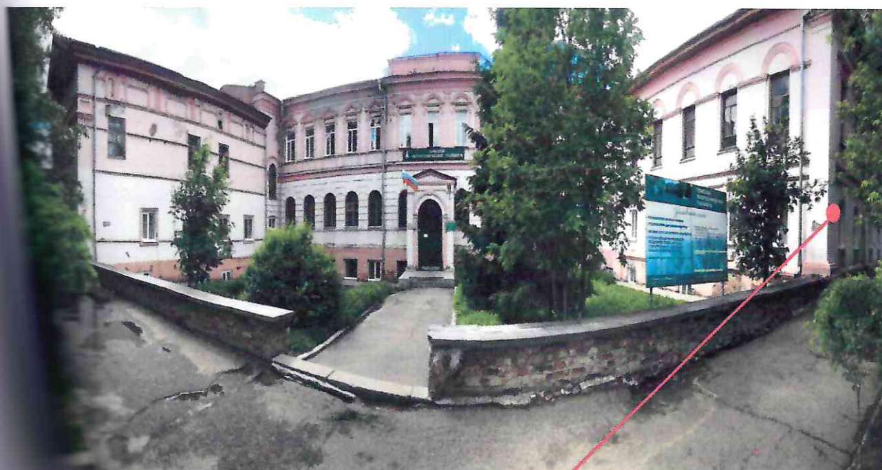
Место расположения информационной надписи