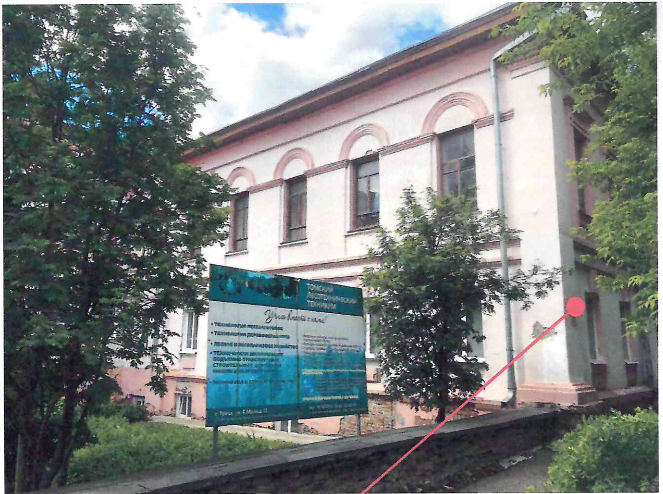
Место расположения информационной надписи