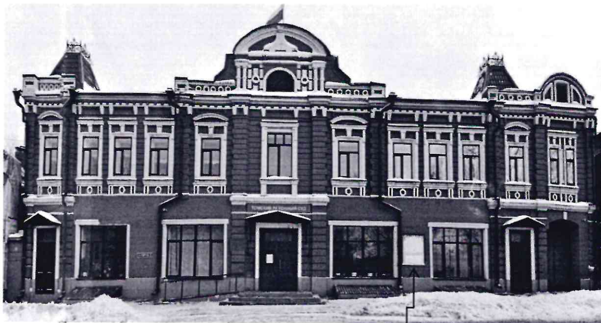
СХЕМА УСТАНОВКИ ИНФОРМАЦИОННОЙ НАДПИСИ

Приложение № 1 к Проекту установки информационной надписи и обозначения объекта культурного наследия регионального значения «Доходный дом И. Тихонова, Кон. XIX в.» Томская область, Томск г., Октябрьский район, улица Обруб, 8