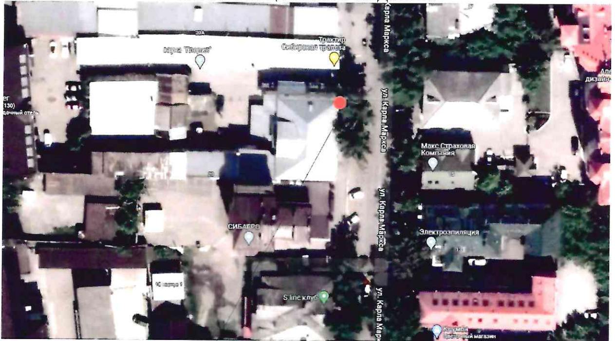
Место расположения информационной надписи