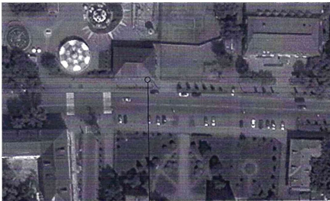
Место расположения информационной надписи