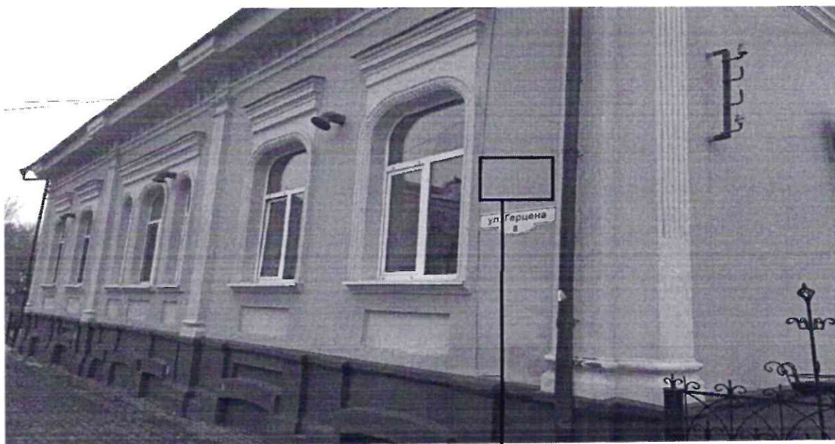
Место расположения информационной надписи