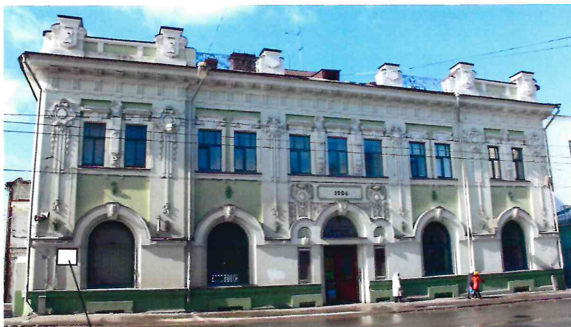
Место размещения информационной надписи