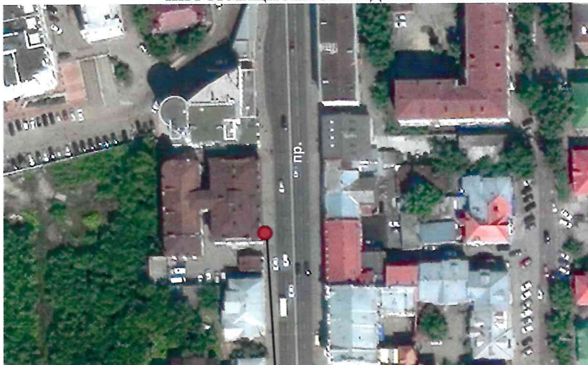
Место расположения информационной надписи