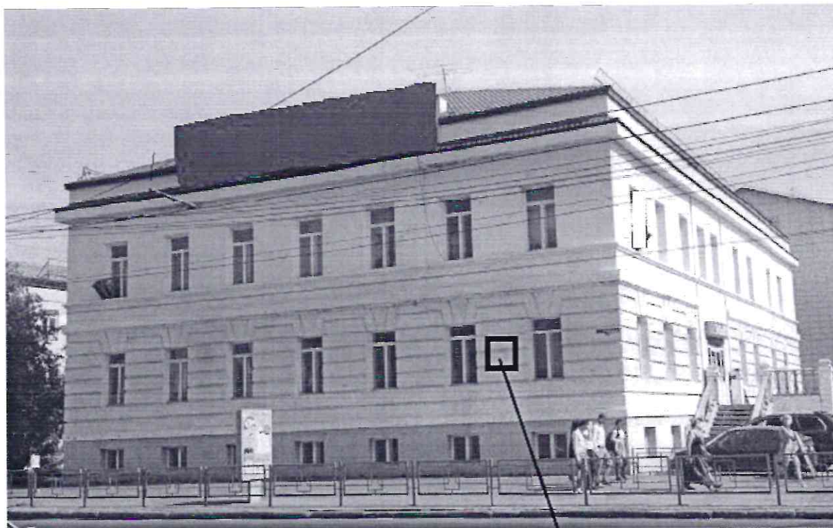
СХЕМА УСТАНОВКИ ИНФОРМАЦИОННОЙ НАДПИСИ