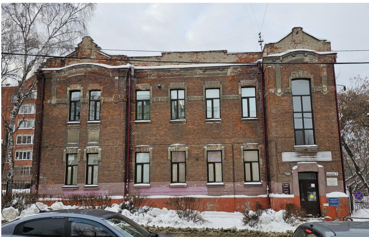
Фото 1. Восточный фасад. Объект культурного наследия регионального значения «Женская богадельня имени Калинина Шушляева, 1912, арх. В.Ф. Оржешко», расположенный по адресу: Томская область, г. Томск, ул. Красноармейская, 17.

Фотографическое изображение объекта культурного наследия регионального значения «Женская богадельня имени Калинина Шушляева, 1912, арх. В.Ф. Оржешко», расположенного по адресу: Томская область, г. Томск, ул. Красноармейская, 17, угол ул. Лебедева, 7 (адрес на момент принятия на государственную охрану: Томская область, г. Томск, ул. Красноармейская, 17) (наименование объекта в соответствии со сведениями из Единого государственного реестра объектов культурного наследия). Фото выполнено 14.12.2025 г. экспертом Евсеевой Е.Ю.