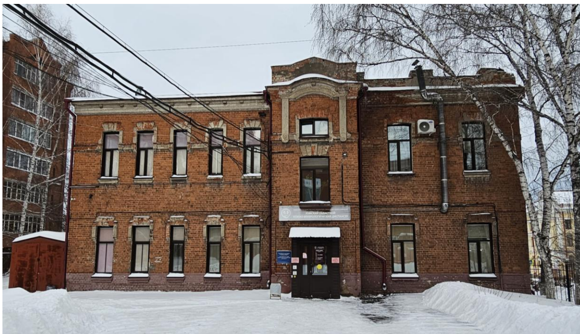
Фото 2. Южный фасад. Объект культурного наследия регионального значения «Женская богадельня имени Калинина Шушляева, 1912, арх. В.Ф. Оржешко», расположенный по адресу: Томская область, г. Томск, ул. Красноармейская, 17.